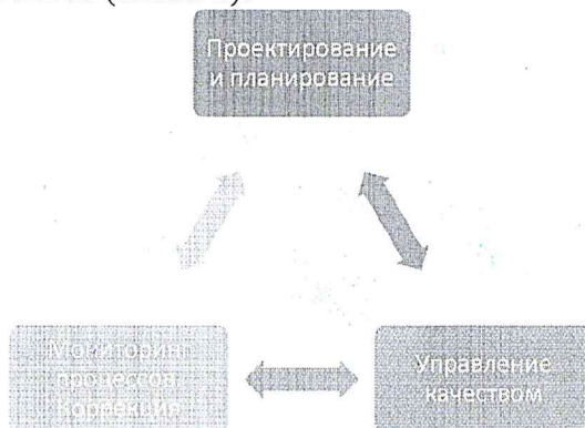
Схема 1. Треугольник управления качеством (модель управления качеством)

Организационная структура ШСУКО. Система управления качеством образования представляет собой непрерывный замкнутый процесс, состоящий из взаимосвязанных и взаимообусловленных элементов (схема 1).